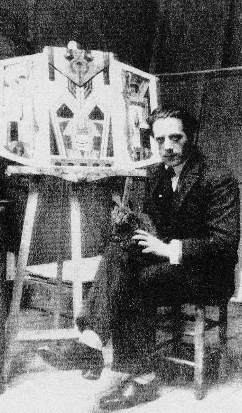
Jean Lambert-Rucki dans son atelier. Paris, 1911.