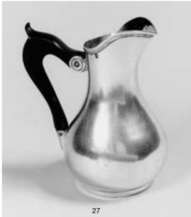
27 ÉLÉGANT POT À LAIT en argent. Le corps piriforme est lisse et surmonté d'un bec verseur légèrement mouluré ; l'anse en bois noir est à double attache. 1 er Coq de Paris 1798/1809. Orfèvre Pierre LAGU qui exerce à partir de 1798. Hauteur : 15,5 cm - Poids : 270 g 800 / 900 € Voir la reproduction ci-contre