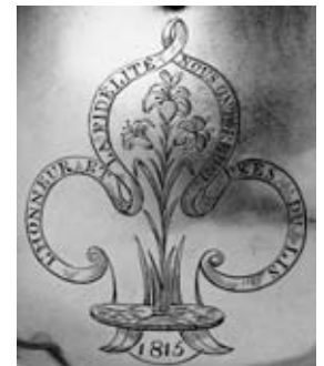
Détail du lot 46

Voir la reproduction ci-dessus et détail ci-contre