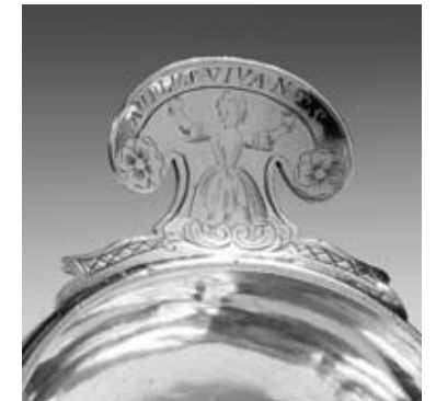
Détail du lot 56

55 COUVERT DE TABLE en argent, modèle uni-plat, la spatule allongée en queue d'aronde. La tige est légèrement monogrammée. Poinçon d'un maître abonné répété trois fois : IDT couronné. XVIII e siècle. Il comporte par ailleurs un petit poinçon non identifié placé à l'intérieur de la spatule. Poids : 168 g 150 / 200 €