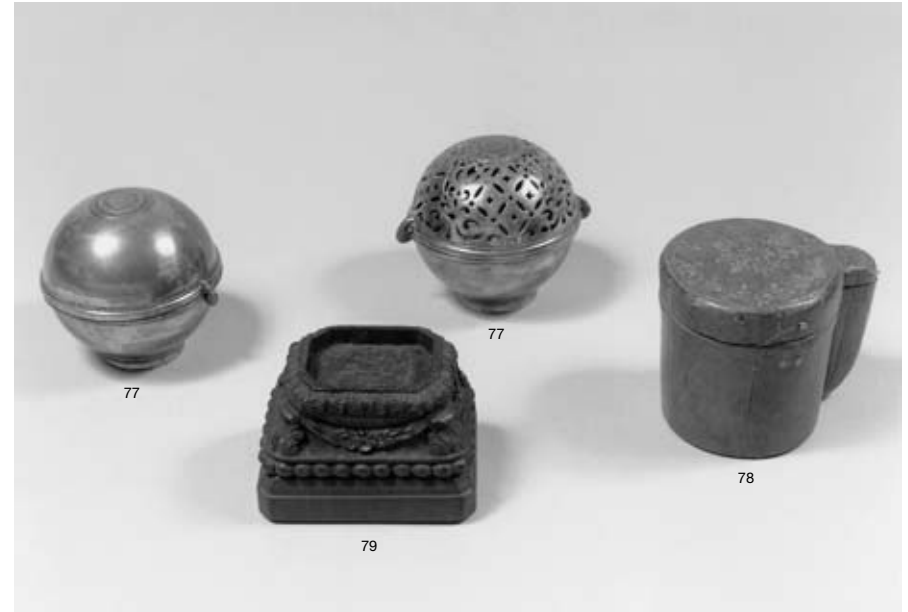
77 PAIRE DE BOULES À SAVON ET À ÉPONGE en bronze argenté. Elles reposent sur une légère bâte ; un couvercle est plein, l'autre est ajouré. Leur particularité est d'être montée à baïonnette. Faiblesse d'argenture. Époque XVIII e siècle. Diamètre : 8 cm