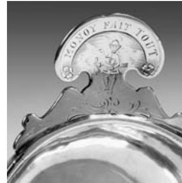
Détail du lot 51

51 TASTEVIN en argent. Le corps lisse est agrémenté d'un appui-pouce, muni d'un anneau passe-doigt, découpé et gravé d'un enfant tenant sous son bras gauche un oiseau surmonté de la devise "MONY FAIT TOUT". Très bien marqué. Présence d'une inscription E. NERON. Paris, 1724-1725. Maître-orfèvre : Jean-Baptiste DUMONT, reçu en 1719. Diamètre : 9 cm - Poids : 126 g 2 500 / 3 000 €