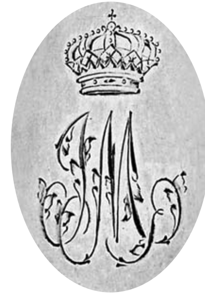
"Ancienne collection du Prince Murat" (numéros 1 à 10)