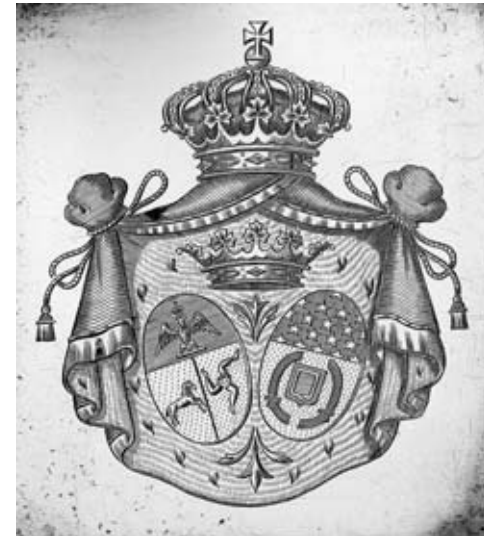
Détail du lot 9