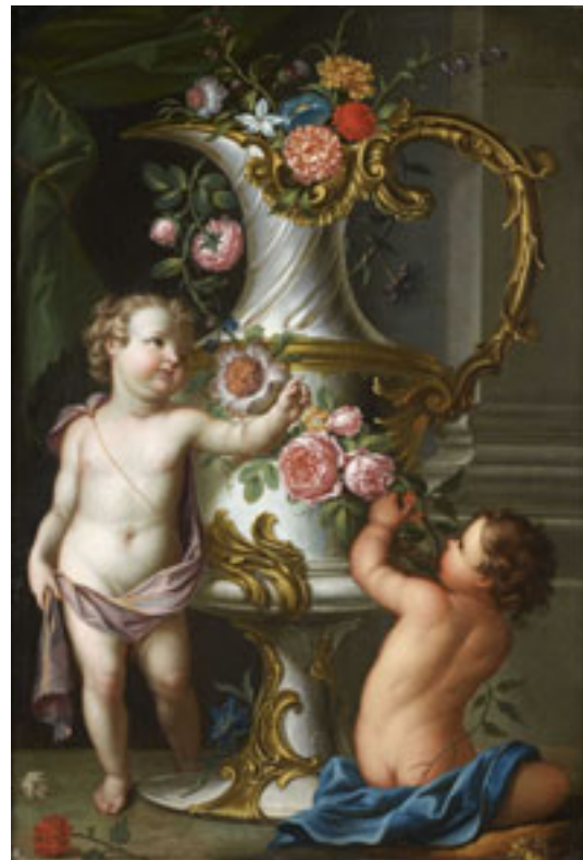
Attribué à Ignaz STERN (1679/1680 – 1748) Aiguières sculptées décorées de guirlandes de fleurs par des putti Paire de toiles 104 x 70 cm Estimation : 20 000 / 30 000 €