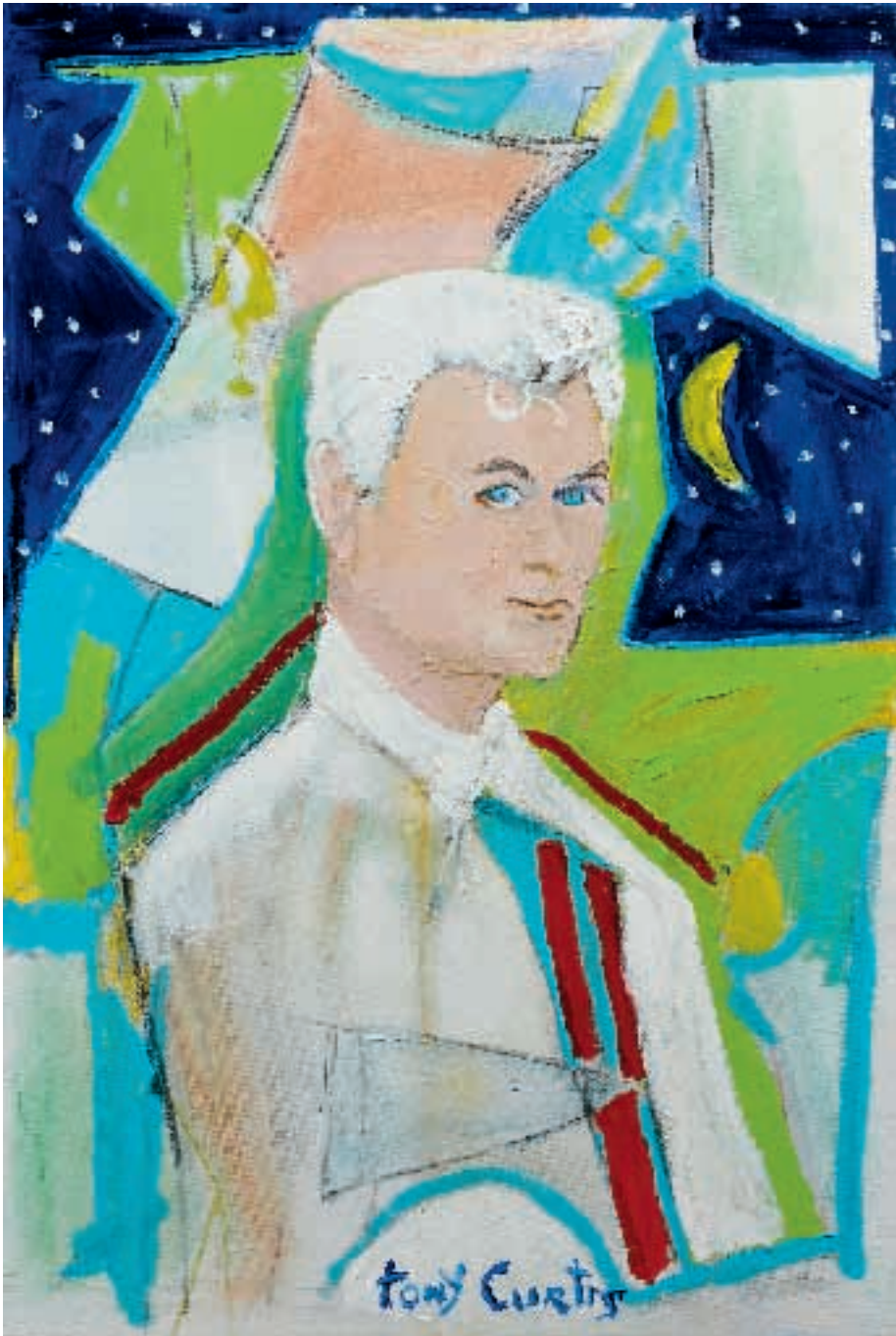
TONY CURTIS SELF PORTRAIT Acrylique sur toile Signée en bas au milieu 91 X 60,5 CM