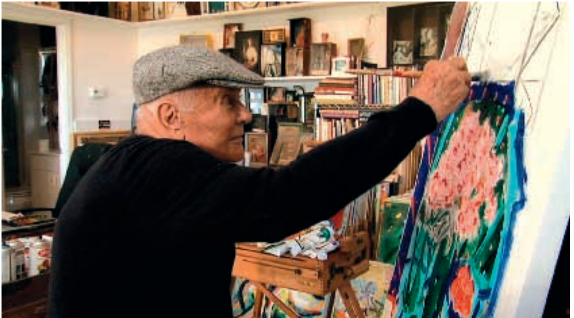
L'artiste dans son atelier